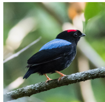
Autor: Fernanda Fernandes