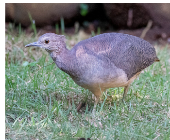
Autor: Fernanda Fernandes